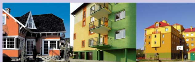
Elewacje wykonane w systemie Terranova

Firma specjalizuje się w handlu detalicznym i hurtowym materiałami budowlanymi.