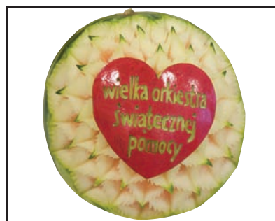
WOŚP w Markach