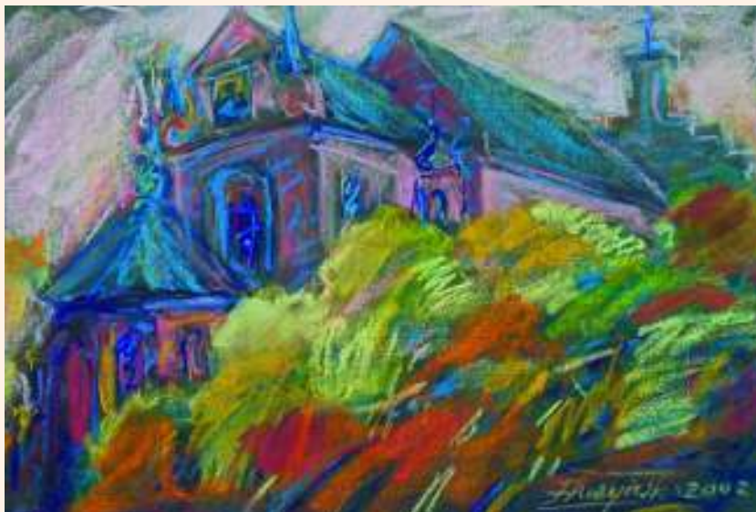
Kościół Św. Anny w Warszawie – pastel