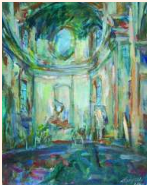
Ruiny wnętrza kościoła w Solanach – akryl