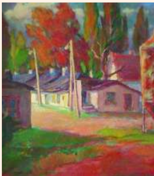
Stara zabudowa w Markach-Pustelniku – olej