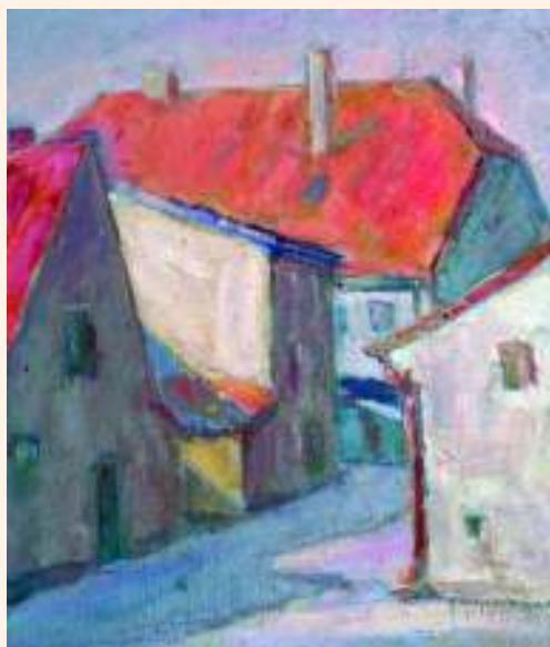
Domy w Dąbrównie – olej