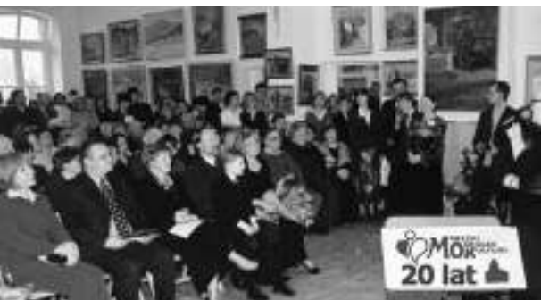
c.d. na stronie 4