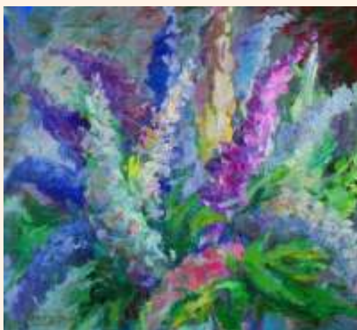
Lubiny – olej

Galeria Mareckiego Ośrodka Kultury, Marki, ul. Fabryczna 2, tel. 781-14-06.