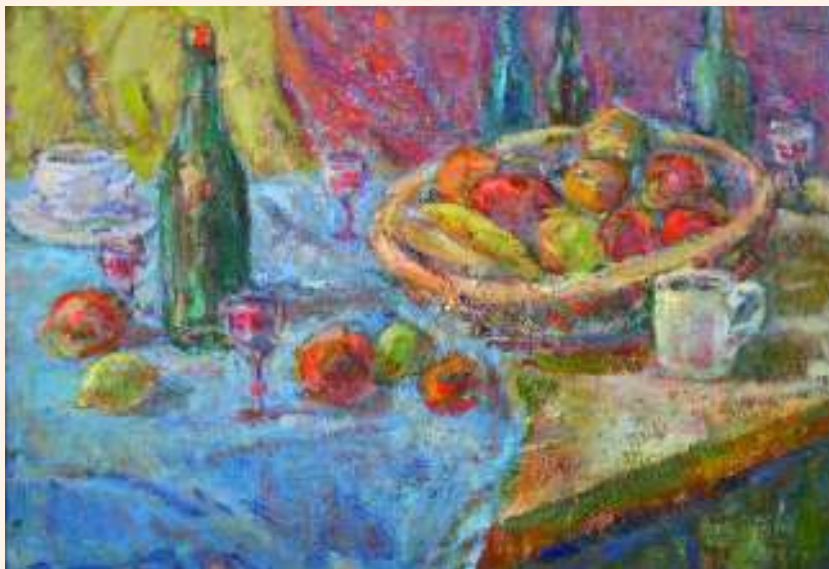
Martwa natura – olej