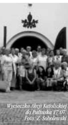
Wycieczka Akcji Katolickiej do Pułtusza 17.07.

W ostatnią niedzielę sierpnia (28) POAK wraz z Kościelną Służbą Porządkową zorganizowaliśmy wyjazd do Sanktuarium Urodzin i Chrztu Świętej S. Faustyny Kowalskiej w Świnicach Warckich, by uczcić 100 lecie urodzin Świętej. W czasie uroczystości jubileuszowych dziękowaliśmy za osobę Św. S. Faustyny, za objawienie Bożego Miłosierdzia, Jego mocy powierzyliśmy wszystkie potrzeby naszego Stowarzyszenia, szczególnie każdego z członków, księży asystentów parafialnych.